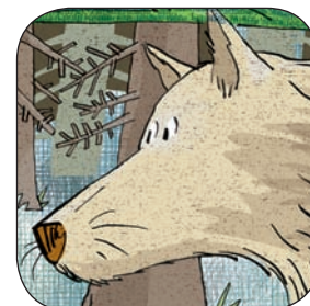
El lobo feroz