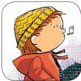
El valiente cazador

Adiviná... ¿quién tiene miedo a quién? Uní con flechas cada personaje de la columna izquierda con aquello que le causa temor.